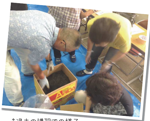
↑過去の講習での様子